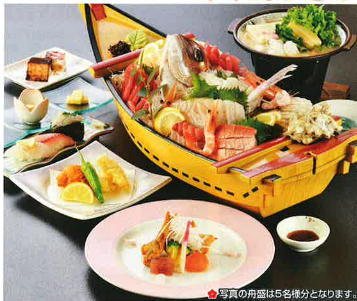
写真の舟盛は5名様分となります。