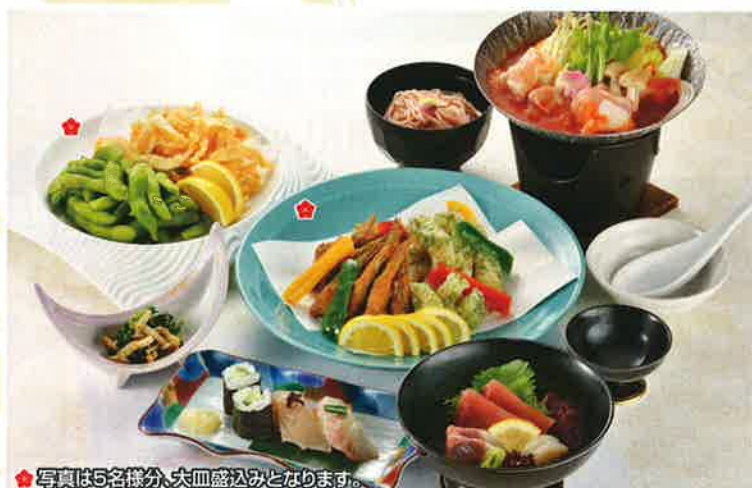
写真は5名様分、大皿盛込みとなります。